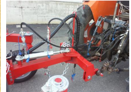
Bis 12,4m: 50-90 PS Kraftbedarf